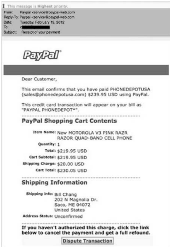
Rysunek 2.2. PayPal jest często wykorzystywany w atakach phishingowych